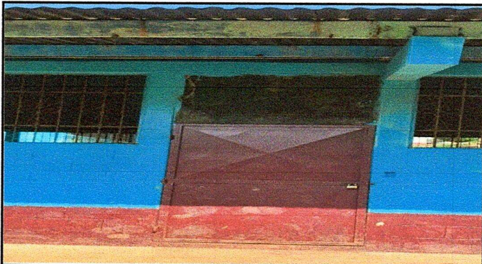
Foto 3: El techo del establecimiento tiene filtración de agua por lo tanto requiere cambio