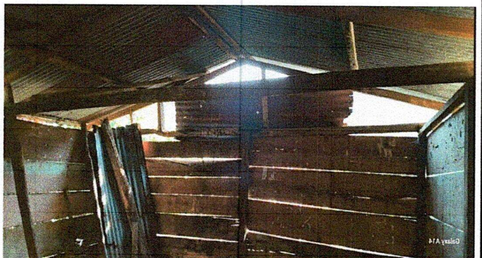
Foto 4: La estructura de la cocina se requiere cambio de techo y costanera.