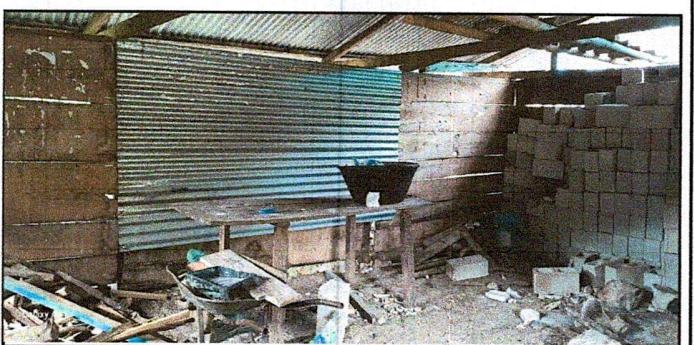
Foto 6: El techo de la cocina muestra el deterioro y su estructura

Observación: Si es necesario se pueden agregar hojas adicionales y actualizar el número de hojas.