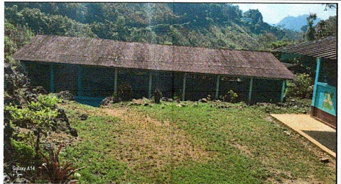
Foto 2: La estructura del establecimiento requiere mantenimiento y cambio de techo.